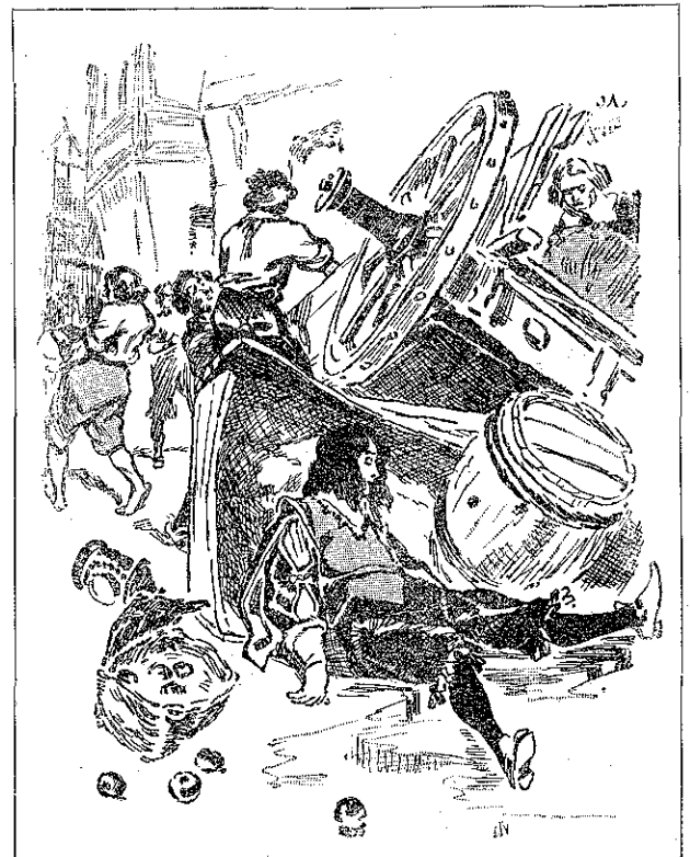
«Ἡ προστάτριά του τὸν ἀφινεν εἰς τὸν δρόμον.» (Σ. 368, στ. 6')

μᾶς ὑπηρετήσατε μὲ πίστιν καὶ μ' ἐν- φύαν· εἰμεθα διὰ τοῦτο πρόθυμοι νὰ σᾶς ἀνταμειψώμεν. Ἡ Ἀντιβασίλισσα, χωρὶς νὰ λέγῃ τίποτε, ἐμειδία εὐμενῶς βλέπουσα τὸν Λούλλην, καὶ ἐφαίνετο ὡς νὰ τὸν ἐνε- θάρρυνε νὰ ὀμιλήσῃ. Ὁ μικρὸς μουσικὸς τὸ ἀπεφάσισε. Διηγήθη τὰς φοβεράς περιπετείας τῆς ἡμέρας ἐκείνης, ἐξηγήσας πῶς εὐρέθη ἑξαφνα μόνος, χωρὶς ἄσυλον, χωρὶς προστασίαν, ἀφού ὁ δοῦξ Γκιζης τὸν ἐπῆρεν ἀπὸ τὴν πατρίδα του διὰ νὰ τὸν σκουδάσῃ καὶ τὸν ἐγκατέλειπεν ἔπειτα εἰς τὸ ἔλεος τῆς Μεγάλης Δεσποινίδος. Ὁ Βασιλεὺς συνωφρῶθη. — Ἦσθε εἰς τὴν ὑπηρεσίαν αὐτῆς τῆς τρελλῆς; ἠρώτησε· καὶ τί ἐκάμνατε λοιπὸν εἰς τῆς ἐξαδέλφης μου; — Ἦμουν μουσικὸς, Μεγαλειότητε!